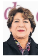
Delfina Gómez Álvarez.

:::: La inversión anunciada por Delfina Gómez , mandataria mexiquense, de 2 mil 516 millones de