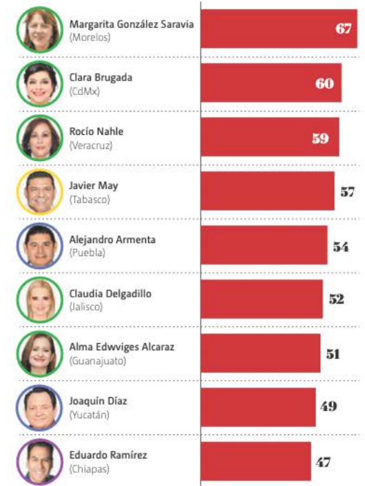
• INFORMACIÓN: Esteban David Rodríguez • GRÁFICO: Moisés Butze

○ Doctorado ○ Maestría ○ Licenciatura ○ Preparatoria ● Edad