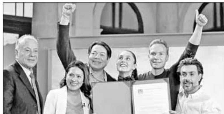
▲ Claudia Sheinbaum, al recibir ayer su constancia como candidata única del PVEM –de la coalición Sigamos Haciendo Historia– a la presidencia de la República. La acompañan (de izquierda a derecha) el legislador del PT

X: @galvanochoa FaceBook: galvanochoa Correo: galvanochoa@gmail.com