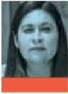
ANA LILIA RIVERA RIVERA PRESIDENTA DE LA MESA DIRECTIVA DEL SENADO @ANALILIARIVRA