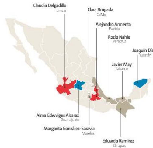
• FUENTE: Morena • INFORMACIÓN: Esteban David Rodríguez • GRÁFICO: Moisés Butze

● Pasan el izquierdómetro ● Ex priistas que pagaron derecho de piso ● Cuota de ex panistas