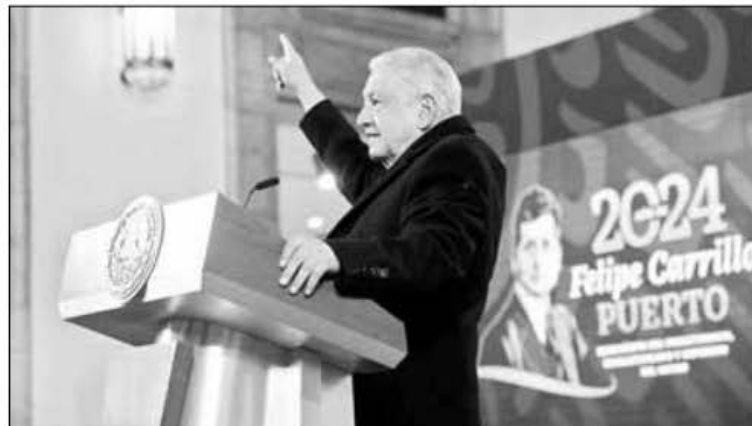
▲ El presidente López Obrador y la secretaria de Gobernación, María Luisa Alcalde, hablaron