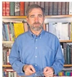
Lorenzo Córdova publicó un video con motivo del Día del Profesional del INE.

Detalló que actualmente más de 17 mil 500 personas trabajan en el INE, tanto en las oficinas centrales como en las 32 juntas locales y en las 300 juntas distritales en toda la República. ●