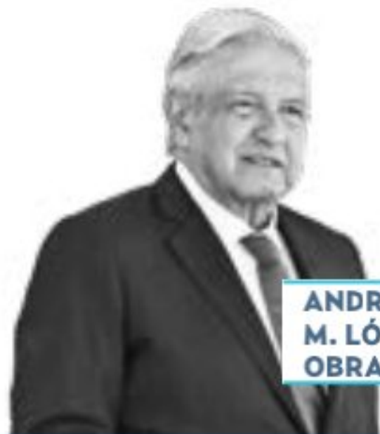
ANDRÉS M. LÓPEZ OBRADOR

› Más promoción económica de México en el extranjero pidió el presidente López Obrador a los embajadores y cónsules. Anoche se reunió en Palacio Nacional con el cuerpo diplomático mexicano, encabezado por el canciller Marcelo Ebrard , y les habló sobre la necesidad de atraer más inversiones. También les solicitó apoyar a los mexicanos en el exterior, sobre todo a los migrantes, así como promover la defensa de los derechos humanos.