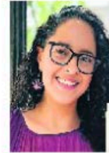
TOMADA DE X