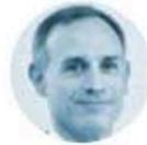
HUGO LÓPEZ- GATELL

► El regio Samuel García se registra hoy como aspirante presidencial de Movimiento Ciudadano. En apariencia sería el candidato único del partido naranja, pero todavía falta conocer la decisión del dirigente Dante Delgado , quien no ha dicho si se registrará, pero sí que no pretende reelegirse como senador. Y de aspirantes externos, es un hecho que no recibirán.