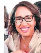
TOMADA DE X

:::: Quien durante las últimas semanas se ha encargado de llenar las calles del municipio de Ecatepec de mantas, espectaculares y pintas en bardas es la diputada local en la Legislatura mexiquense, Azucena Cisneros , quien a propósito de su informe de actividades se ha encargado de promover su imagen. Nos dicen que tanta propaganda tiene un doble objetivo, pues la diputada está interesada en ser la próxima presidenta municipal de uno de los ayuntamientos más poblados del país. Así que al puro estilo de las corcholatas presidenciales, doña Azucena promueve... su informe de actividades.