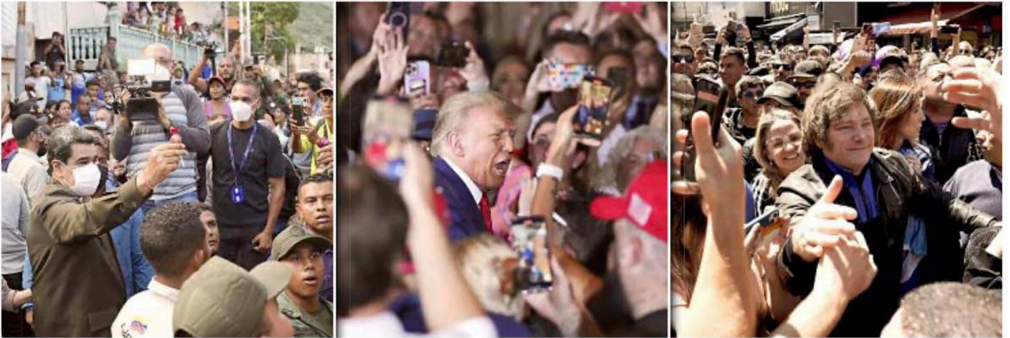
■ Maduro, Trump y Milei son algunos de los más connotados líderes populistas de la actualidad.