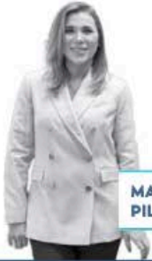
MARINA DEL PILAR ÁVILA

► Tremendo espaldarazo dio el presidente López Obrador a la gobernadora de Baja California, Marina del Pilar Ávila . Ayer, en una conferencia en esa entidad, el tabasqueño se refirió a ella en estos términos: "La gobernadora de ustedes es excepcional, de verdad. No le estoy haciendo la barba , pero es excepcional". No sólo eso, sino que hoy será el invitado estelar al Segundo Informe que rinde la mandataria en Rosarito, a las 11 de la mañana.