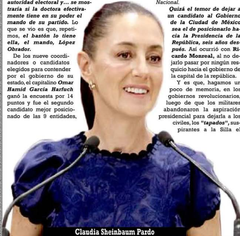
Claudia Sheinbaum Pardo

De los nueve coordinadores o candidatos elegidos para contender por el gobierno de su estado, el capitalino Omar Hamid García Harfuch ganó la encuesta por 14 puntos y fue el segundo candidato mejor posicionado de las 9 entidades,