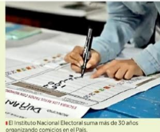
El Instituto Nacional Electoral suma más de 30 años organizando comicios en el País.

Las elecciones libres y auténticas son una conquista de generaciones de mexicanas y mexicanos que creyeron y creen que la democracia es el único camino a la paz y al desarrollo sostenible, basados en la igualdad, la libertad y el pleno ejercicio de los derechos civiles", indicaron.