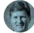
ENRIQUE DE LA MADRID