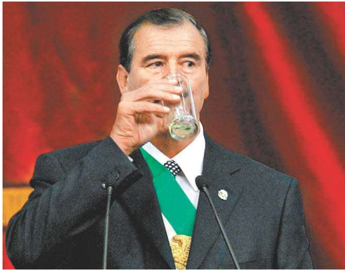
La de Fox (2000) ha sido la sucesión presidencial más tersa de la historia.