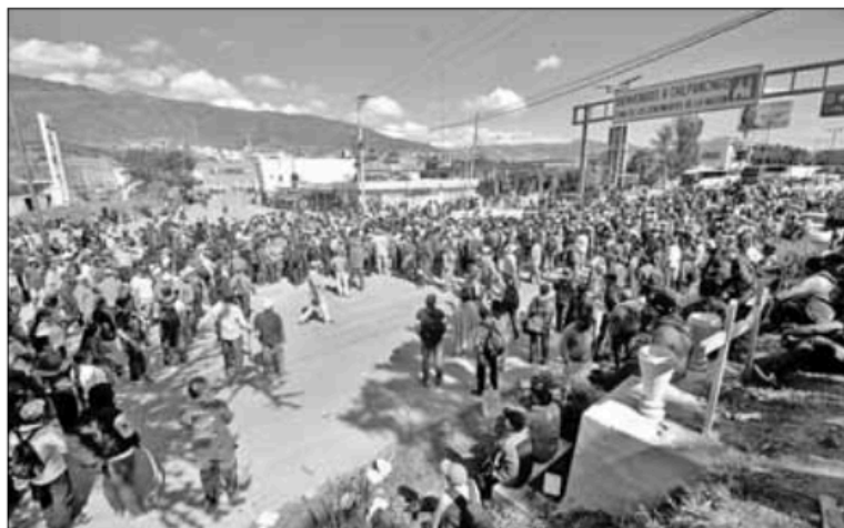
▲ Por segundo día consecutivo, pobladores del Circuito Azul y la Montaña de Guerrero bloquearon la Autopista del Sol y marcharon hacia el palacio de gobierno en Chilpancingo.

EN LA MAÑANERA se caracterizó a las movilizaciones del lunes en Chilpancingo a partir del cártel llamado Los Ardillos ; horas más tarde, el gobierno morenista de Guerrero dialogó, negoció y prometió obras (en términos nada claros) durante una reunión con los representantes de ese movimiento que, en reciprocidad, desactivó sus protestas. Todo ello, ¿qué quiso decir? (habría que recurrir al traductor mental de Vicente Fox en Los Pinos, Rubén Aguilar)... El tema de Xóchitl Gálvez se ha vuelto recurrente en las conferencias matutinas de prensa del presidente López Obrador, lo cual regala a la virtual candidata opositora la oportunidad de reaccionar declarativamente en medios y redes sociales y, como es el caso, de presentar denuncias judiciales: antes, por la réplica fundacional, que Palacio Nacional debió conceder y, ahora, por violencia política de género... Hubo manifestaciones de periodistas en Oaxaca, Guadalajara y la Ciudad de México en protesta por la ejecución del periodista Luis Martín Sánchez Iñiguez en Nayarit, en demanda de justicia en este caso y de atención y protección en otros que son del conocimiento de las autoridades. Pero... Y, mientras las corrientes de ultraderecha insisten en postular al ex cantante y actual productor cinematográfico Eduardo Verástegui como candidato presidencial independiente, contra la “derechita cobarde” y la “comunista” Gálvez, ¡hasta mañana, con Enrique Alfaro visitando a AMLO en Palacio Nacional!