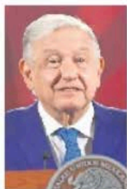
GERMÁN ESPINOSA. EL UNIVERSAL

::::: Donde hay una crisis constitucional en ciernes es en el Congreso de la Unión, porque en 2024 se van a empalmar las legislaturas saliente y entrante. Nos hacen ver que en la reforma que estableció que el Presidente tome posesión el 1 de octubre y la legislatura el 1 de