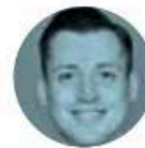
LUIS DONALDO COLOSIO

► Por cierto, a quienes se preguntan por qué Ricardo Anaya no se inscribió al proceso de la oposición para elegir abanderado presidencial, hay dos motivos. Uno: no se quiso arriesgar a que la FGR le eche el guante por el caso Odebrecht. Y dos: operará en el extranjero los Comités de Acción Migrante del Frente Amplio por México.