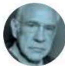
JOSÉ ÁNGEL GURRÍA

► Un tema que está generando un alud de críticas internas en Morena es el de los espectaculares que promueven a las corcholatas . El presidente López Obrador pidió evitar ese tipo de propaganda, y el dirigente del partido, Mario Delgado , adjudicó su colocación y financiamiento a los “queda bien” y llamó a los aspirantes a “poner orden”. El caso es que hay más de un contendiente inconforme y si la dirigencia no lo resuelve el tema llegará al INE.