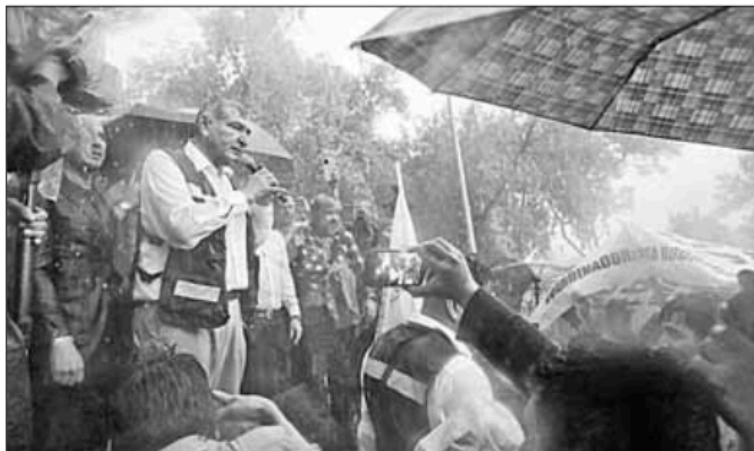
▲ Adán Augusto López habló un par de minutos ante simpatizantes en el Monumento

Facebook, Twitter: galvanochoa Correo: galvanochoa@gmail.com