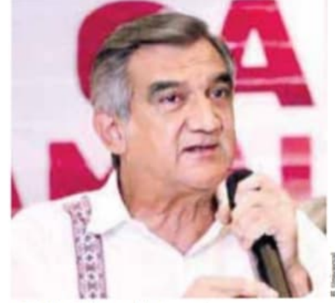
Américo Villarreal | Tamaulipas.