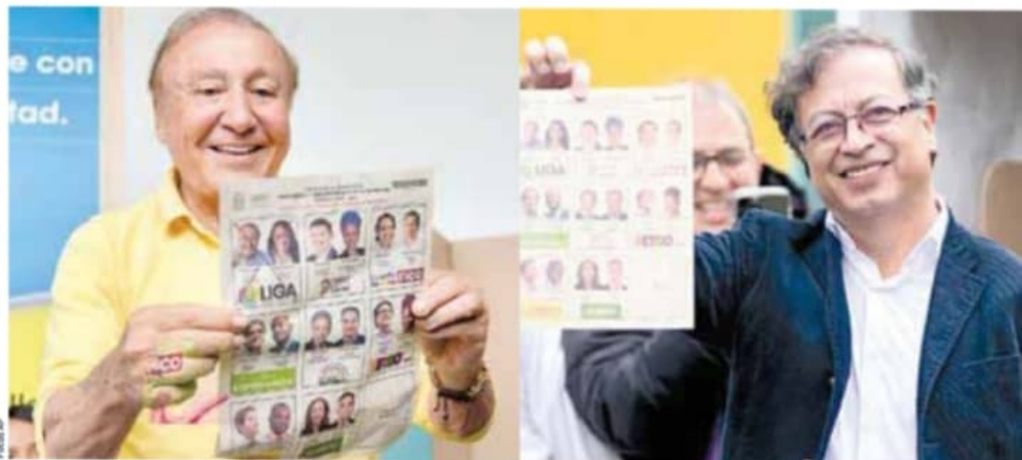
Hernández y Petro | A segunda vuelta.

Por su lado, Gustavo Petro, de 62 años, compite por tercera ocasión por la Presidencia. Ha tenido una dilatada participación en la política de su país, que va desde haber formado parte del grupo guerrillero (ya desmovilizado) M-19 hasta haber sido alcalde de la capital, Bogotá. Ubicado ideológicamente dentro del amplio espectro de la denominada izquierda progresista, Petro ha recibido el apoyo de diversos e influyentes actores de la política nacional que incluyen lo mismo antiguos colaboradores cercanos de los expresidentes Álvaro Uribe y Juan Manuel Santos, que influyentes líderes religiosos protestantes.