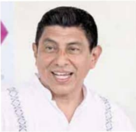
Salomón Jara | Oaxaca.