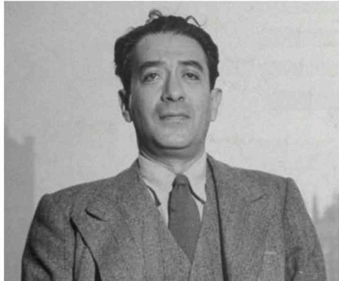
Lombardo Toledano representó la izquierda de la Revolución, especialmente activa en la década de 1930-1940.

Ante una situación como aquella, los efectos en el morenismo resultan por