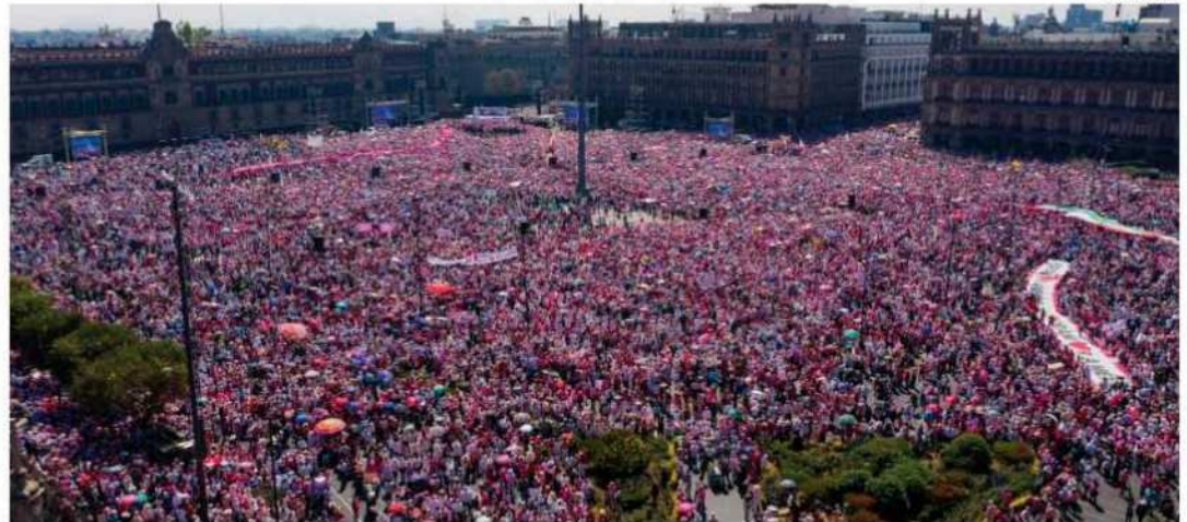
Miles de ciudadanos ocuparon el Zócalo y sus alrededores el 26 de febrero de 2023, en una segunda marcha contra el “plan B” electoral del presidente Andrés Manuel López Obrador.

El presidente de la república descalificó esa marcha, en la mañana del día siguiente diciendo que fue un “striptease del conservadurismo”. Otra frase desafortunada, fue: “Los que se manifestaron ayer, lo hicieron en contra de la transformación y no son demócratas...lo hicieron a favor de la corrupción, lo hicieron a favor del racismo, a favor del clasismo,