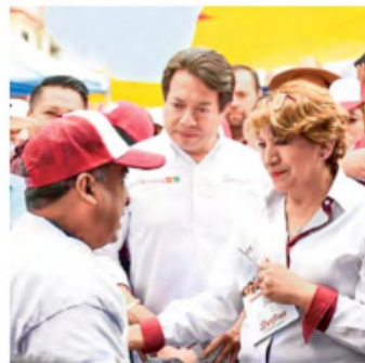
CAMBIO. La aspirante morenista al Edomex ya había aceptado su participación en el ejercicio.

Debido a ello, el órgano electoral del Estado de México indicó que sólo se organizarán los dos que marca la ley. /24HORAS