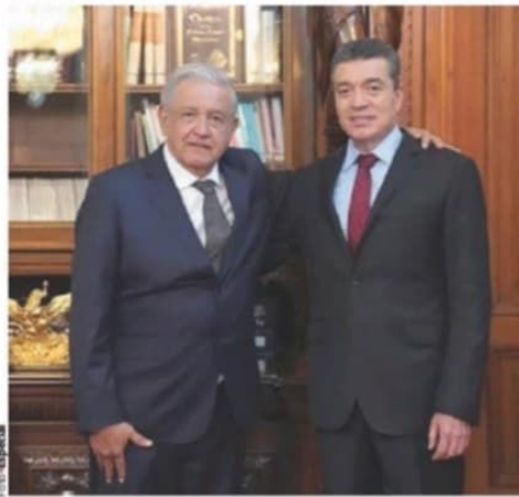
EL PRESIDENTE López Obrador, con el gobernador de Chiapas, Rutilio Escandón, en imagen de archivo.

EL PRESIDENTE propondrá que baje el porcentaje de asistencia ciudadana en la consulta de revocación para que sea vinculante; en reforma prevé sistema de sufragio electrónico