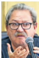
Paco Ignacio Taibo II.

:::: El aumento de librobuses en Nezahualcóyotl es una iniciativa que refuerza el acceso a la cultura y el fomento a la lectura en un municipio con una sólida tradición literaria. La alianza entre el Fondo de Cultura Económica y el ayuntamiento demuestra que la descentralización de los libros y su acercamiento a las comunidades pueden generar un impacto positivo en el hábito lector. La alta demanda de estas unidades itinerantes confirma que el interés