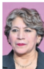
Delfina Gómez Álvarez.

:::: La reducción del 23.5% en homicidios dolosos en el Estado de México, encabezado por Delfina