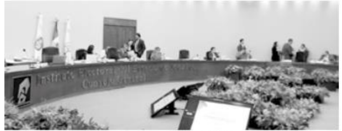
Instituto Electoral del Estado de México (IEEM).

Es así que como parte del Informe Acumulado del Periodo de Precampaña 2024 del Monitoreo a Medios de Comunicación Alternos y Cine, se validaron 446 registros del Sistema Integral de Monitoreo a Espectaculares y Medios Alternos, de los que 168 son de propaganda electoral y 278 de propaganda política; misma que fue clasificada