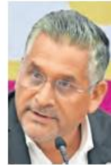
Gerardo Pliego Santana.

El reconocimiento de que la corrupción permea sectores clave como la policía, el Poder Judicial, la administración de tierras y los servicios públicos confirma lo que la ciudadanía ha denunciado por años: la impunidad y los sobornos siguen siendo un problema estructural. Que el propio diputado presidente de la comisión de Combate a la Corrupción, Gerardo Pliego Santana , acepte la necesidad de fortalecer el Sistema Anticorrupción es un avance