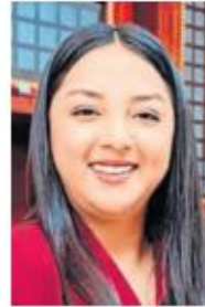
Valeria Cruz Olvera.

:::: La reapertura de un tiradero a cielo abierto en Aculco no solo representa un retroceso en materia ambiental, sino que también es una muestra del desinterés de la administración municipal de Valeria Cruz Olvera por atender una problemática que los vecinos llevan más de una década denunciando. La acumulación de desechos en este sitio pone en riesgo los mantos acuíferos y expone a la población a niveles alarmantes de contaminación, lo que hace urgente una intervención por parte del gobierno estatal. Ignorar estas advertencias no solo afecta la salud de los habitantes, sino que contribuye al deterioro del entorno, afectando también la calidad de vida y la actividad económica de la región. El hecho de que la basura sea depositada durante la madrugada, en el marco de campañas de limpieza, genera dudas sobre la transparencia de estas acciones y deja entrever una estrategia para ocultar el problema en lugar de resolverlo.