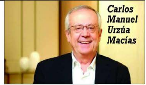
Carlos Manuel Urzúa Macías

A mbiente enrarecido prevalece a unos cuantos meses de que se lleve a cabo el proceso electoral en el país; proceso en el que se jugarán 20 mil cargos públicos, entre diputaciones locales, federales, senadurías, alcaldías, gubernaturas y la más importante, la Presidencia de México; sin embargo, la incertidumbre crece, pero, sobre todo, por el cómo se inflan las listas electorales con extranjeros ¡y muertos!