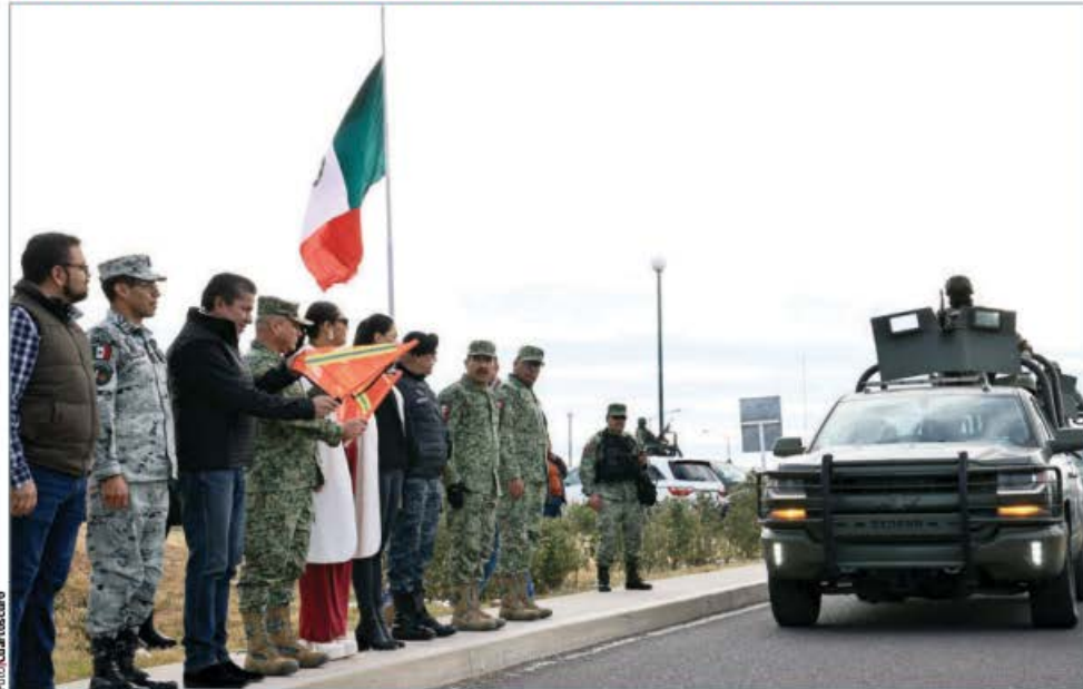
ELEMENTOS del Ejército mexicano arribaron el pasado sábado a Fresnillo, Zacatecas, para fortalecer la estrategia de paz en la entidad.

a la alcaldía de Ecatepec por Morena, y ya había denunciado amenazas, extorsión y presión política por parte de líderes de la Unión de Sindicatos y Organizaciones Nacionales (USON).