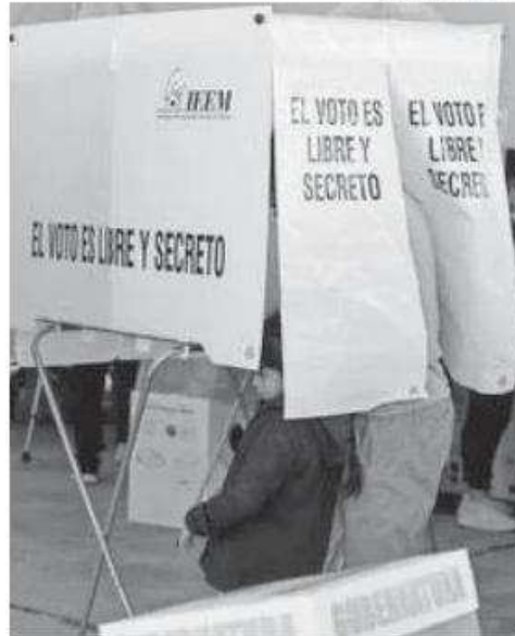
La votación será el 2 de junio

En ese sentido, deberán cumplir con los siguientes requisitos: Ser ciudadana o ciudadano mexicano en pleno goce de sus derechos civiles y políticos; no ser, ni haber sido miembro de dirigencias nacionales, estatales o municipales de organización o partido político alguno en los tres años anteriores a la elección y no ser, ni haber sido candidata o candidato a puesto