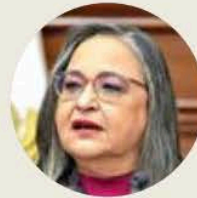
● Norma Lucía Piña Hernández

reforma aprobada que transformará de raíz al Poder Judicial se hizo sin un diagnóstico. La segunda marca un sello de origen: la reforma se edificó sobre una narrativa falsa repetida una y otra vez. Y dejó frases como esta: “Cada vez que la Suprema Corte resolvió un caso que el gobierno percibió contrario a su proyecto político, los ministros que votamos en contra fuimos acusados de traidores, corruptos, aliados de minorías rapaces y de la delincuencia organizada y de cuello blanco”. Como sea, se marcha derrotada. Su acción y narrativa han sido derrotadas. Aunque, se sabe, la historia nunca dicta su última palabra. Menos en asuntos de esta hondura.