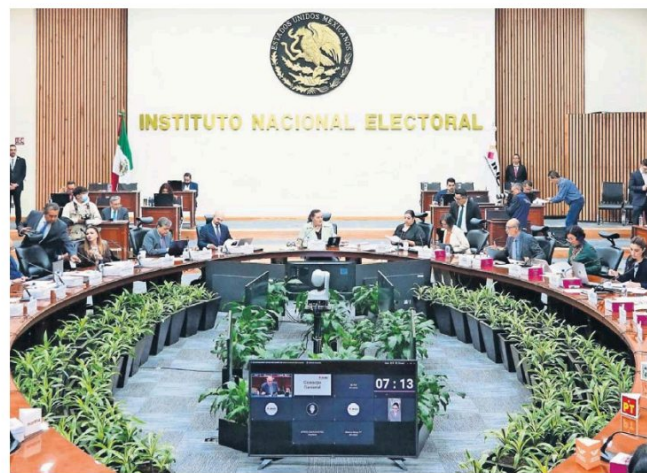
El Consejo General del INE aprobó un presupuesto precautorio para realizar el proceso electoral extraordinario el próximo año cuando se elegirán 881 cargos de jueces, magistrados y ministros.