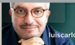
LUIS CARLOS UGALDE

La votación que avala la reforma judicial es contablemente válida, pero espuria por cooptar senadores, excluir y usar la justicia para presionar.