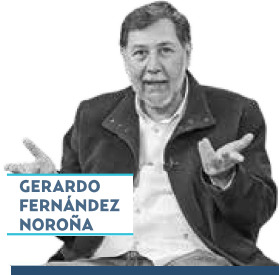
GERARDO FERNÁNDEZ NOROÑA

► Por primera vez en la historia, un grupo de ciudadanos tomó por asalto el recinto, el salón de plenos y la tribuna del Senado de la República, por lo que su presidente, Gerardo Fernández Noroña , decretó receso y convocó a nueva sesión, esta vez en la ubicación de la vieja casona de Xicoténcatl, para debatir y votar la Reforma al Poder Judicial en una maratónica sesión.