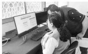
Los programas benefician económicamente a maestros que no son sujetos a catálogos de puestos de la USICANIM.

Los folios que resultaron procedentes pueden ser consultados en el portal del Sindicato www.smsem.mx