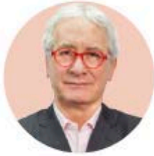
POR JAVIER SOLÓRZANO ZINSER