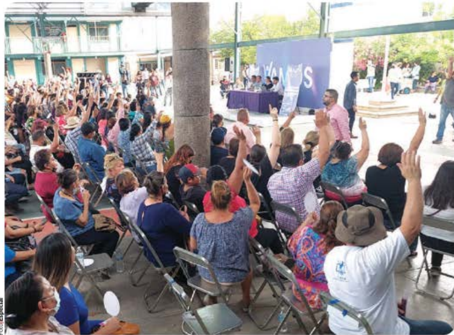
ASAMBLEA para la conformación de un partido político local en Sonora.

partes de los municipios de la entidad, quienes deberán contar con credencial para votar en dichos municipios o demarcaciones; bajo ninguna circunstancia, el número total de sus militantes en la entidad podrá ser inferior al 0.26 por ciento del padrón electoral que haya sido utilizado en la elección local ordinaria inmediata anterior a la presentación de la solicitud de que se trate.