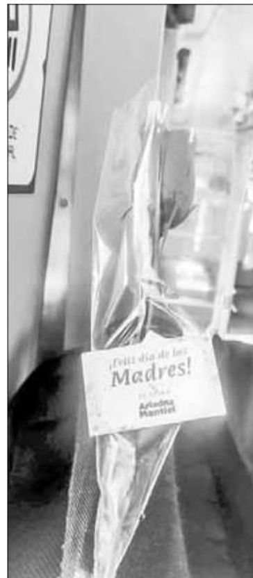
▲ Por el Día de las Madres, pasajeras del Metro recibieron una rosa con la tarjeta que tenía rotulado el nombre de la titular de la Secretaría de Bienestar, Ariadna Montiel Reyes.

POR CIERTO, CUALQUIERA de estos días la señora Martha Delgado, hoy subsecretaria de Asuntos Multilaterales y Derechos Humanos de la SRE, anunciará su deseo de competir por la jefatura de Gobierno, aunque dicen que Marcelo Ebrard ya tiene candidata para la ciudad.