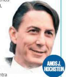
AMOS J. HOCHSTEIN

las comercializadoras petroleras que incumplen con el límite de precio de 60 dólares por barril de petróleo ruso. No sólo eso. Hochstein trabaja intensamente porque a nivel global se avance en el uso de energías renovables, vehículos eléctricos y todo lo que ello implica en semiconductores y baterías. En lo primero está su interés en abordar las inversiones de energías eólica y solar en el Corredor Interoceánico del Istmo de Tehuantepec; en lo segundo, la producción minera de Sonora, no sólo de cobre, sino de litio, para las baterías de autos eléctricos, minerales cuya demanda va en crecimiento y las empresas mineras necesitan acelerar su explotación y procesamiento.