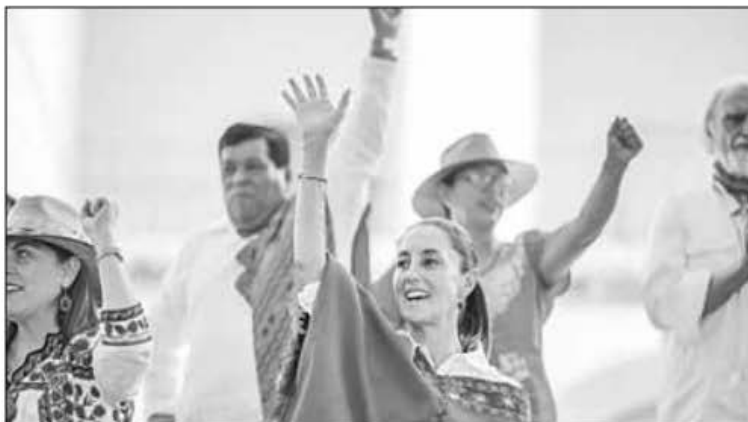
▲ En el 105 aniversario luctuoso de Emiliano Zapata, la candidata presidencial de Morena, PT y PVEM firmó con organizaciones