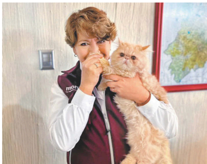
La morenista presumió a su gato.