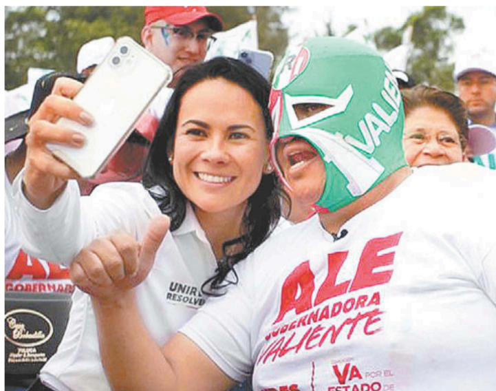
La priista fue bien recibida en su visita a Nezahualcóyotl.