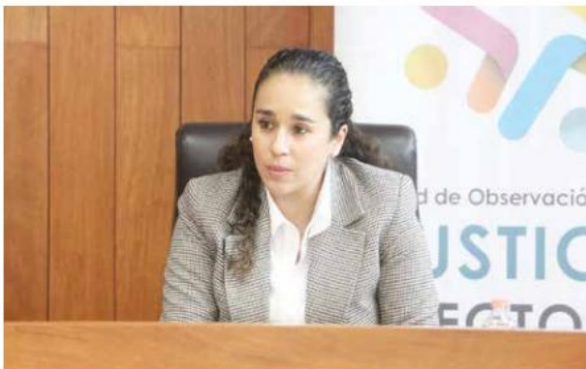
Amalia Pulido, presidenta del Instituto Electoral del Estado de México.

Fue ahí que se determinó que habrá dos debates organizados por el árbitro electoral;