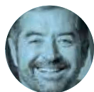
JUAN RAMÓN DE LA FUENTE

› Para frenar especulaciones, la presidenta Claudia Sheinbaum habló de la salida de Rogelio Ramírez de la O de la Secretaría de Hacienda. Recordó que conversaron del tema desde antes de octubre del año pasado, pero le pidió mantenerse en el cargo para trabajar el proceso de transición y evitar turbulencias financieras por el cambio de gobierno. Dijo también que su relevo, Edgar Amador , tiene un buen perfil para poder tomar las riendas de esta institución.