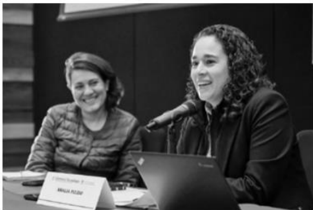
La consejera presidenta invitó a las y los estudiantes a participar como observadoras y observadores electorales.

Señaló que las y los mexiquenses recibirán 10 boletas de las cuales, cuatro serán para elegir cargos de magistraturas y jueces locales, mientras que las seis restantes corresponden a cargos federales.