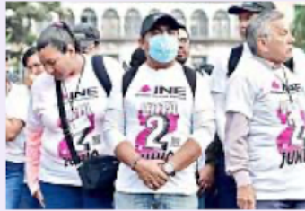
El trabajo de los capacitadores arrancó sin celulares del INE.

Se afirma que el OIC exigió más empresas, lo que implicó más estudios de