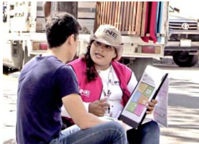
■ En una primera etapa, entrevistan a los posibles funcionarios de casillas para el 2 de junio.

De esta primera etapa deberán salir unos 3 millones de mexicanos que, en un primer momento, aceptaron ser representantes de casilla, y entre el 9 de abril y el 1 de junio realizarán la segunda capacitación, más detallada y con simulacros de la jornada electoral.