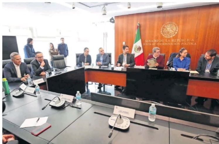
TOMADA DE TWITTER

Colectivos señalan que reforma electoral busca desmantelar al INE ; Monreal dice que Corte decidirá