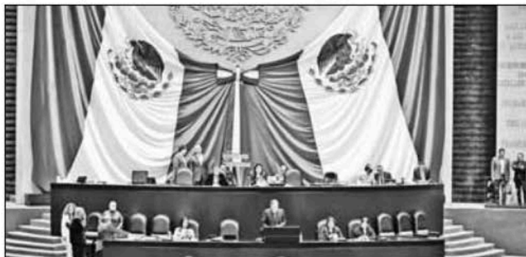
▲ En medio del debate por las obras emblemáticas del presidente Andrés Manuel López Obrador, como el Tren Maya, la