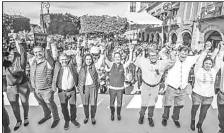
▲ En su visita ayer a León, Guanajuato, Claudia Sheinbaum señaló que es "absolutamente falso" que funcionarios de la STPS hayan