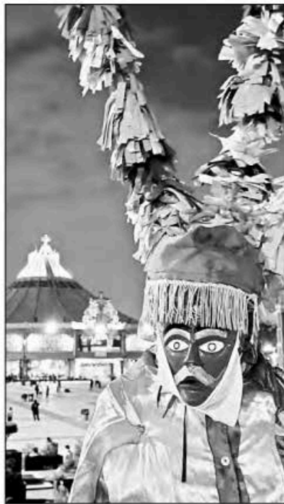
▲ Continúa la llegada de feligreses a la Basílica de Guadalupe.

MEDIO BILLÓN DE pesos (500 mil millones) es el impacto económico de la corrupción en el país, de acuerdo con el estudio del capítulo nacional de la Cámara de Comercio Internacional (ICC México). Su reporte se basa en datos de