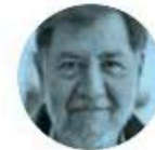
GERARDO FERNÁNDEZ NOROÑA