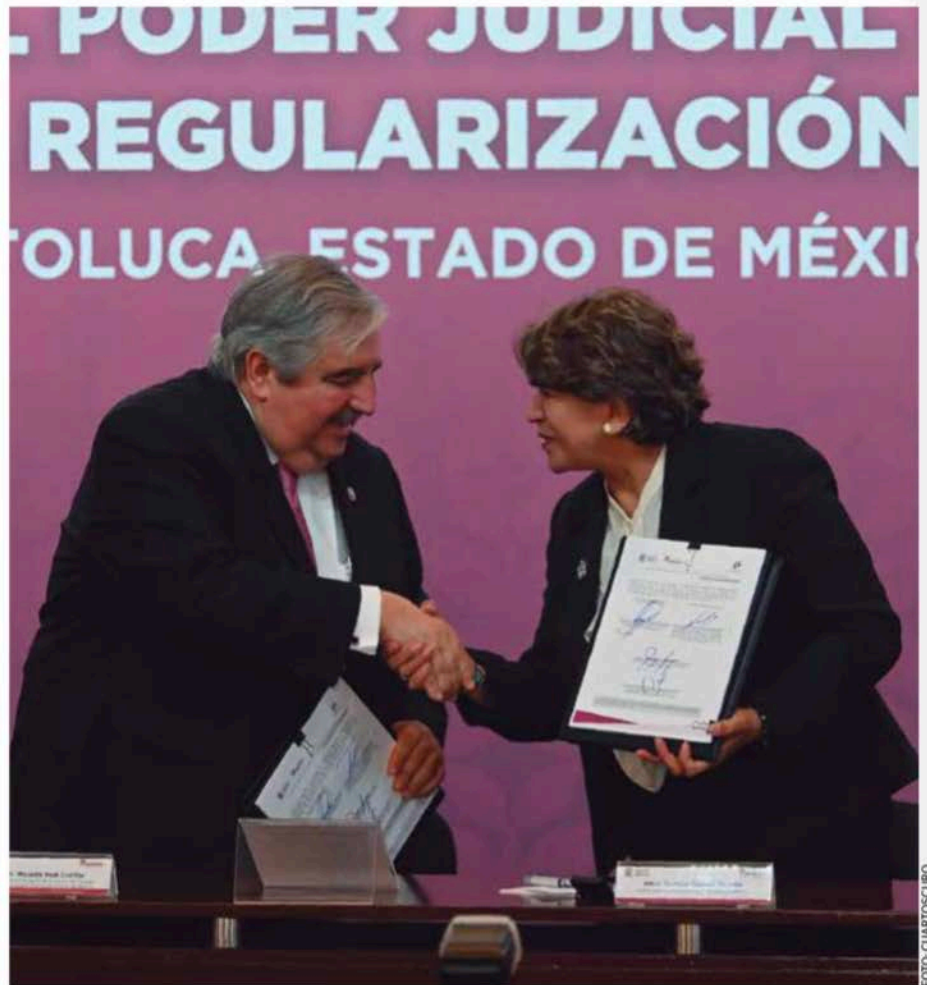
El Estado de México, gobernado por Delfina Gómez, busca homogeneizar las políticas municipales con las estatales.

Agua potable, drenaje, alcantarillado, tratamiento y disposición de sus aguas residuales, alumbrado público, limpia –recolección, traslado, tratamiento y disposición final de residuos–, mercados y centrales de abasto, panteones, rastro, calles, parques y jardines, y la seguridad pública (policía preventiva municipal y tránsito). El eje de la política municipal de Morena en todo el país debe ser garantizar a la población el derecho a la ciudad y el derecho a la movilidad.