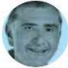
ADÁN AUGUSTO LÓPEZ

› Habrá que estar atentos de lo que suceda hoy en Acapulco, donde la presidenta Claudia Sheinbaum encabezará el Consejo Nacional de Seguridad Pública con todos los gobernadores y la jefa de Gobierno de la Ciudad de México. Además, con Evelyn Salgado , de Guerrero, tendrá una reunión privada. Será la cuarta visita de la mandataria al Puerto. Estará acompañada también por los secretarios de Seguridad y Gobernación, Omar García Harfuch y Rosa Icela Rodríguez .