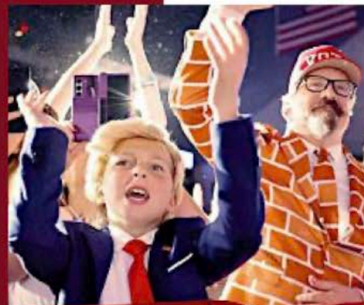
El triunfo del republicano significa su regreso a la Casa Blanca, que ocupó entre 2017 y 2021.

Una de las tantas paradojas de la elección es que la clase trabajadora blanca y latina ha apostado por un líder político que difícilmente mejorará sus condiciones de vida. Trump gobernará en alianza con los plutócratas de su país —con Elon Musk— y recortará impuestos para los más ricos. Las promesas de incrementar los aranceles para proteger al sector manufacturero estadounidense sólo encarecerán los productos del mercado nacional, que dependen de insumos baratos, y podrían producir un nuevo repunte inflacionario. Habrá recortes a la salud, a la educación, a las redes de seguridad social que Biden intentó tejer de nuevo, para recrear un Estado del Bienestar para el siglo XXI. Si comienzan las