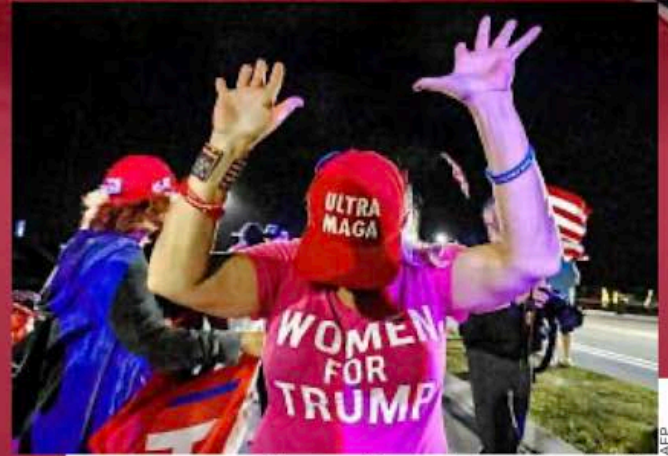
El apoyo a Trump entre las mujeres también aumentó respecto a sus campañas anteriores.

TRAS LA ELECCIÓN PRESIDENCIAL ESTADOUNIDENSE, ANALISTAS DESMENUZAN LAS CAUSAS Y CONSECUENCIAS DEL TRIUNFO ARROLLADOR DEL CANDIDATO REPUBLICANO. ADVIERTEN RIESGOS Y DESAFÍOS PARA LA DEMOCRACIA, ASÍ COMO UN PANORAMA COMPLICADO PARA MÉXICO EN LOS PRÓXIMOS CUATRO AÑOS.