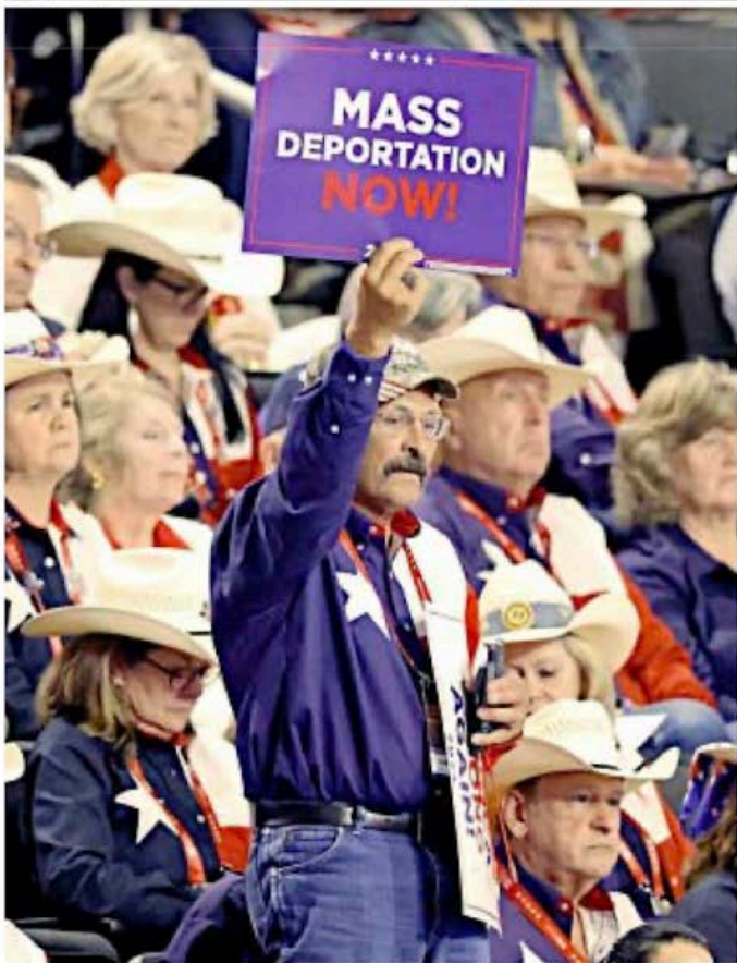
Los temores a la migración y la seguridad fronteriza fueron dos puntos clave en la decisión de los electores.