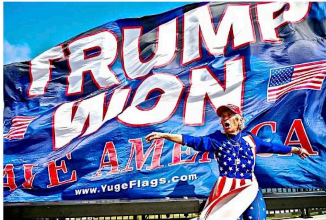
■ Por primera vez en sus tres elecciones, Trump ganó en el voto total de los estadounidenses.

UNA DE LAS TANTAS PARADOJAS DE LA ELECCIÓN ES QUE LA CLASE TRABAJADORA BLANCA Y LATINA HA APOSTADO POR UN LÍDER POLÍTICO QUE DIFÍCILMENTE MEJORARÁ SUS CONDICIONES DE VIDA (...) HABRÁ RECORTES A LA SALUD, A LA EDUCACIÓN, A LAS REDES DE SEGURIDAD SOCIAL QUE BIDEN INTENTÓ TEJER DE NUEVO, PARA RECREAR UN ESTADO DEL BIENESTAR PARA EL SIGLO XXI.