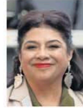
HUGO SALVADOR. EL UNIVERSAL

:::: Este fin de semana se dio a conocer el Manual de Identidad Institucional del Gobierno de la Ciudad de México, en el que se define la identidad gráfica que acompañará a la administración de Clara Brugada . En el documento se destaca que el logotipo del go-