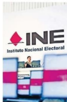
Morenistas ordenaron una encuesta sobre la reforma.

Dijo que la encuesta tuvo un costo de 350 mil pesos, y la del INE fue de 48 mil pesos.