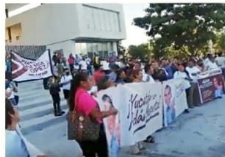
Simpatizantes recibieron al Secretario de Gobernación, Adán Augusto López, a su llegada al Congreso de Yucatán.

"Me han comentado que el coordinador de los diputados de Morena, Ignacio Mier; el coordinador del Partido Verde, Carlos Puente; el coordinador del PT, Alberto Anaya, y el coordinador del PRI, Rubén Moreira, han iniciado una serie de pláticas, de reuniones de trabajo, con el objetivo de presentar un iniciativa de reforma constitucional en materia electoral", informó.