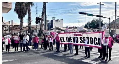
AVANZADA. Ciudadanos de Sonora se manifestaron ayer en Hermosillo contra la reforma electoral promovida por el Presidente López Obrador y en defensa del INE.

Hasta el momento se han registrado 51 organizaciones de la sociedad civil, y se replicarán las movilizaciones en 35 ciudades del interior del País, así como en Los Ángeles, California.