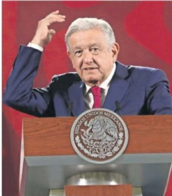
El Presidente llamó racistas, clasistas, filis e yanhíscos a los asistentes de la marcha en defensa del INE.

Presidente invita a culminar protesta en favor del INE frente a Palacio Nacional; organizaciones critican que quiera determinar "cómo, dónde y hasta con quién" marchar