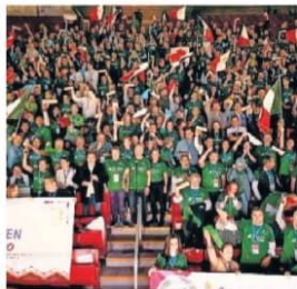
Miembros de la Coparmex se manifestaron a favor del INE en el estadio Akron de Guadalajara.