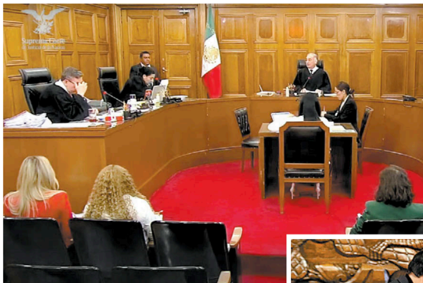
Sesión de la Corte; el presidente del Senado, Gerardo Fernández Noroña y la presidenta, Norma Piña, el martes.

Sin embargo, la ministra Piña se negó a entregar la información, a lo que Fernández Noroña acusó que da “respuestas burocráticas y pone obstáculos para cumplir con esta disposición constitucional”, pero advirtió que eso no impedirá que se instrumente la reforma, ni evitará