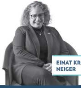
EINAT KRANZ NEIGER

Tras el ataque de Hamas a Israel, el presidente López Obrador mantiene la postura de no tomar partido y se pronunció por un diálogo. Pero sus palabras no fueron bien recibidas por la embajadora de Israel en México, Einat Kranz Neiger , quien, en el programa radiofónico de Sergio y Lupita , expresó: “valoraríamos que México considere una posición que condene de manera contundente los actos bárbaros perpetrados por Hamas”.