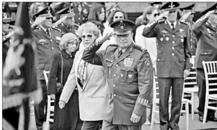
▲ El secretario de la Defensa Luis Crescencio Sandoval y su esposa, en una Ceremonia del Bicentenario del Colegio Militar, en el Castillo

DOS DATOS FINALES: la Comisión Nacional de Elecciones agregará a las listas de los consejos estatales los nombres que considere relevantes, y varios de los consejos estatales están dominados por sus gobernadores morenistas. ¡Hasta mañana!