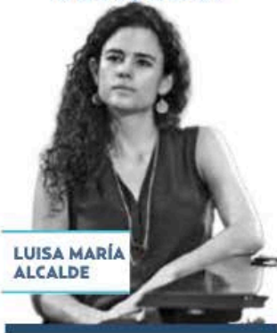
LUISA MARÍA ALCALDE

▶ Apuntadísima está la secretaria de Gobernación, Luisa María Alcalde , para convertirse en la próxima dirigente nacional de Morena. La funcionaria declaró que para ella sería “un honor” asumir la presidencia del instituto político fundado por el presidente López Obrador . De hecho, la presidenta electa la calificó ayer como “una gran compañera”, y refirió que toca al partido decidir quién lo presidirá. Eso sí, aclaró que “tiene que haber separación entre gobierno y partido”.