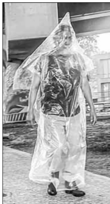
▲ Ante la lluvia que azotó la tarde de ayer a toda la Ciudad de México, un ciudadano decidió salir muy bien protegido para no mojarse.