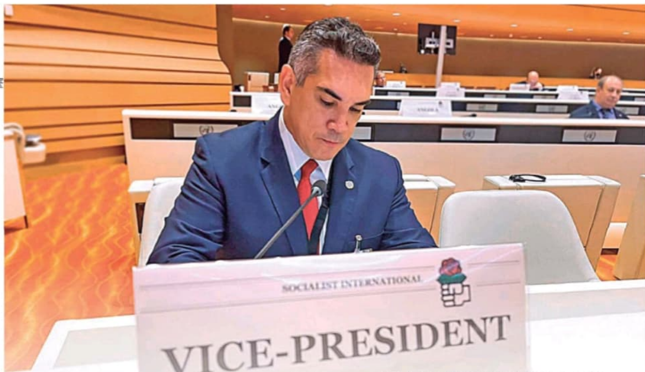
Moreno. En Ginebra