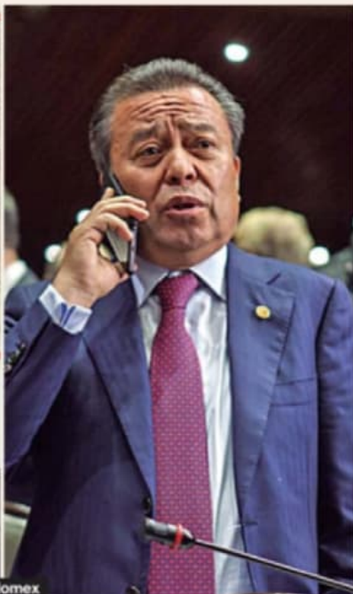
Navarrete Prida y Camacho Quiroz. Operación Edomex

Marcelo Ebrard, y el secretario de Gobernación, Adán Augusto López.