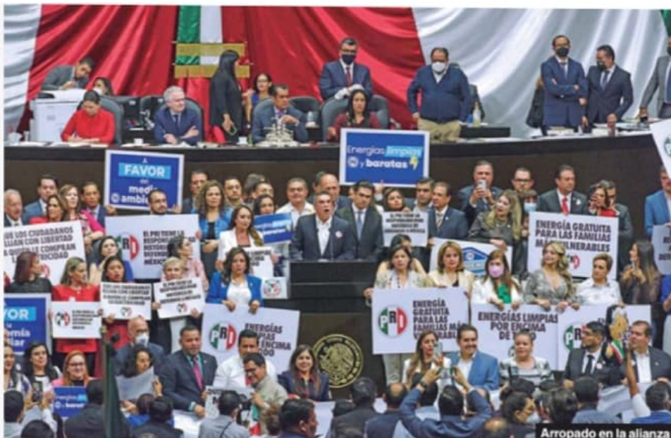
Arropado en la alianza