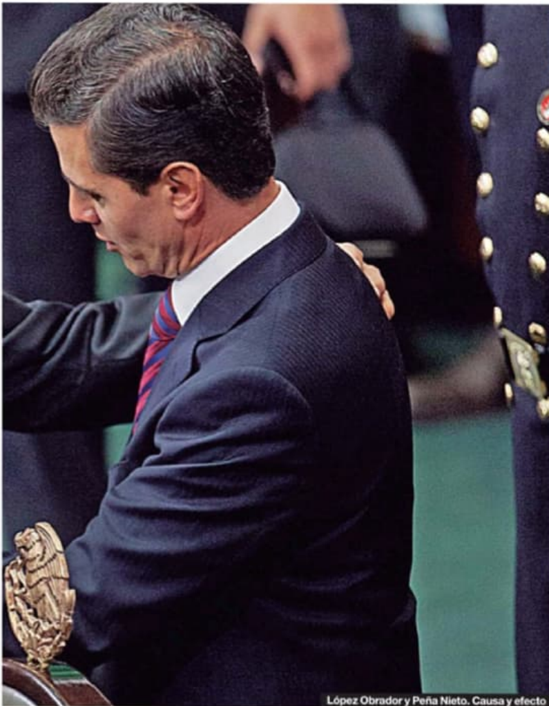
López Obrador y Peña Nieto. Causa y efecto

Hasta ahora había amagos de actuar contra el exmandatario priista, como sucedió a raíz de la denuncia del exdirector de Pemex Emilio Lozoya, quien acusaba al exsecretario de Hacienda Luis Videgaray y a Peña Nieto de ser quienes recibieron y gestionaron los sobornos de la constructora brasileña Odebrecht.