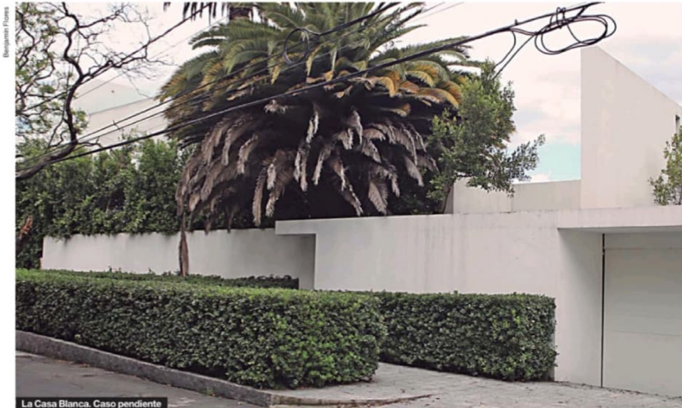
La Casa Blanca. Caso pendiente

En años recientes periodistas de varios medios –incluyendo Proceso – fueron al municipio de El Oro, en la frontera entre el Estado de México y Michoacán, para consultar el libro físico del registro de Plasti-Estéril. En el documento aparecía que los