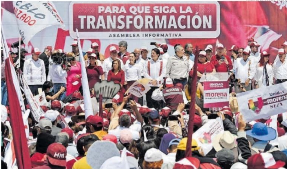
En días pasados Morena hizo un mitin en Toluca.