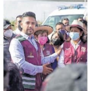
Alcalde de Neza, Adolfo Cerqueda.