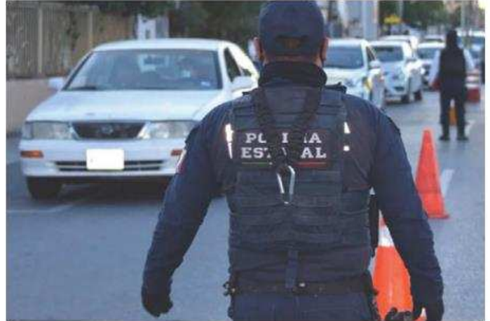
Se trata de 41 hombres y 36 mujeres. ARCHIVO

Además, se apoya con protección a 15 aspirantes a regidor, cuatro síndicos y un presidente municipal que busca reelegirse. “El protocolo establece que las medidas se otorgan 48 horas de manera indiscriminada y luego