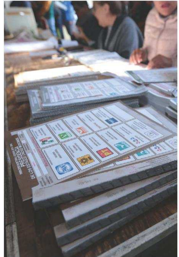
El INE adquiere la tinta indeleble del politécnico.

En promedio cada boleta tiene un costo de 2.43 pesos, lo cual es un ahorro comparado con los