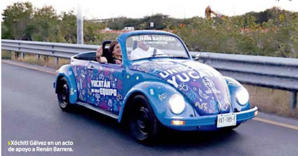
■ Xóchitl Gálvez en un acto de apoyo a Renán Barrera.

Incluso, justifica, lo mismo se decía en la elección del 2021, y el PAN, solo, ganó los 10 municipios más poblados y actualmente gobierna al 76 por ciento de los yucatecos. ■