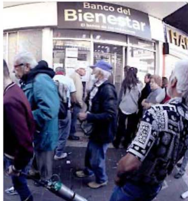
■ Los apoyos sociales, principalmente a personas de la tercera edad, se han incrementado en el actual sexenio.

Posdata: 30 años después, México sigue “con hambre y con sed de justicia”. (Luis Donaldo Colosio Murrieta. 6 de marzo 1994) ■