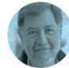
GERARDO FERNÁNDEZ NOROÑA

► Carlos Slim , presidente de Grupo Carso, quien hace un año dijera que Telmex ya no era negocio, pero no se vendería, convocó hoy a conferencia, en sus oficinas. Se espera que el hombre más rico de México hable de Trump y los aranceles, así como de su relación con la presidenta. Hace un año el encuentro duró casi cinco horas.