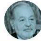
CARLOS SLIM HELÚ

► Resultados a la vista está dando la Operación Frontera, coordinada por el Gabinete de Seguridad, encabezado por el secretario de Seguridad, Omar García Harfuch . El gobierno informó de la detención de 139 personas y el aseguramiento de 82 armas de fuego, 28 de ellas se reportó que son provenientes de Estados Unidos.