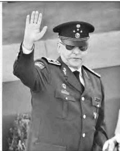
▲ Mandos del Ejército hicieron fila para saludar al ex secretario de Defensa Salvador Cienfuegos, detenido en 2020 en Estados