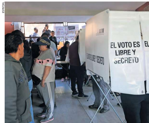
Los órganos electorales deberán buscar los mecanismos que permitan a la ciudadanía garantizar un ejercicio confiable, entendible.

A la par, admitió que son los jóvenes el grupo etario que se ha ido desencantando de los procesos electorales, precisando que a nivel nacional de las personas entre 15 a 17 años el 78 por ciento refiere que tiene ‘algo o mucho’ interés en los asuntos públicos, de 18 a 19 años es el 81.4 por ciento y de 20 a 29 años el 83.1 por ciento. El politólogo, docente e investigador de la Universidad Autónoma del Estado de Mé-