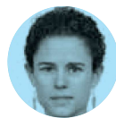
LUISA MARÍA ALCALDE