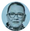
ROSA ICELA RODRÍGUEZ