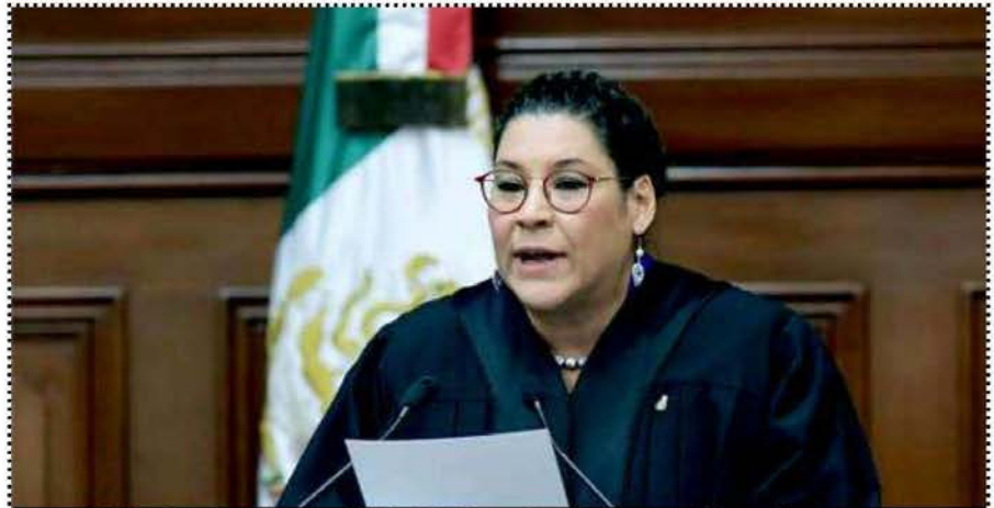
Ministra de la SCJN, Lenia Batres Guadarrama

La Corte analiza procedimientos legislativos, pero no legisla, su única función es la de salvaguardar y garantizar a la sociedad la integridad jurídica y apego a los valores constitucionales de dichos procedimientos