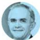
MIGUEL ÁNGEL MANCERA

» Al rescate de la presidenta del INE, Guadalupe Taddei , salió su homóloga del Tribunal Electoral, Mónica Soto . La magistrada alista una sentencia para tirar el acuerdo con el que los consejeros electorales rebeldes obligaban a Taddei a nombrar a titulares de 16 áreas clave antes del 20 de enero. Y nos dicen que se va a aprobar.