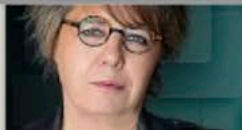
GABRIELA WARKENTIN @warkentin

El 3 de junio sabremos si supimos ya no solo sobrevivir a una intensa contienda electoral, sino si seguiremos siendo país. En caso de que hoy lo seamos.