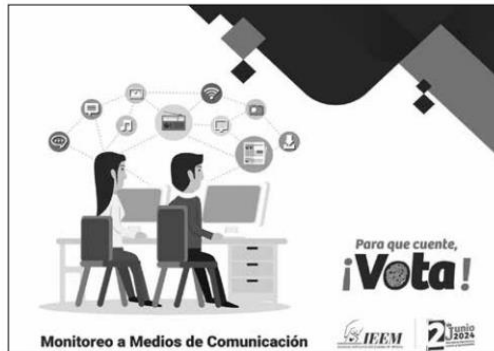
El seguimiento a medios que realizará el IEEM abarca diferentes etapas del proceso electoral.

La finalidad del monitoreo de medios es respaldar la fiscalización de partidos, coaliciones y candidaturas independientes y, en su caso, determinar si hubo exceso en sus gastos; además, permite detectar información que no respeta o discrimine al género femenino, a candidatas o