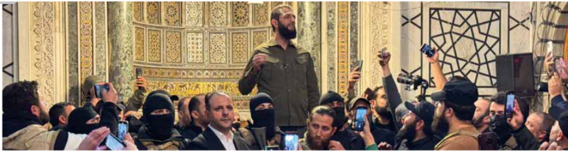
Derrocamiento. Abu Mohamed Al Jolani, líder de los rebeldes de Siria, en su primera aparición desde la caída de Al-Asad, ayer.