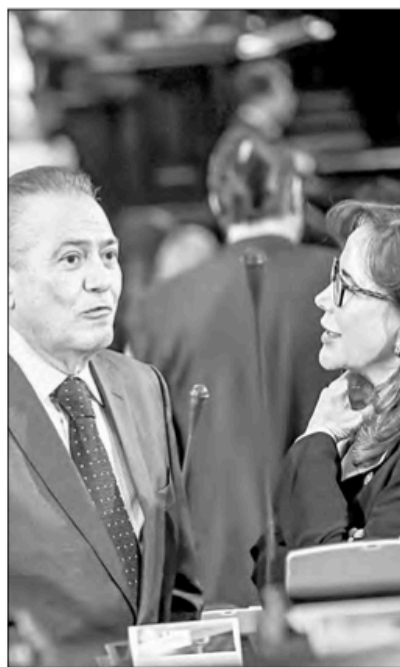
▲ Manlio Fabio Beltrones y Yeidckol Polevsky, en el contexto de la sesión solemne en la casona de Xicoténcatl por los 200 años de la instauración del Senado de la República, a la que también acudió la titular de la Corte.