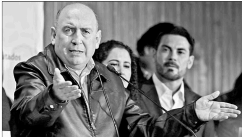
▲ El diputado priísta Rubén Moreira, durante la sesión de ayer donde se aprobó por unanimidad