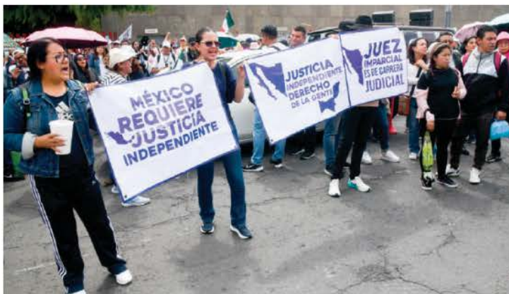
TRABAJADORES DEL PODER JUDICIAL se manifiestan afuera de San Lázaro, ayer.

Batres carecieron de materia, porque fueron propuestas por juzgadores y magistrados, quienes solicitaron detener el proceso legislativo de la reforma el 3 de septiembre y que culminó con su publicación el 15 de septiembre.