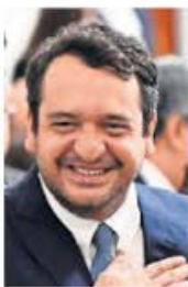
Andrés Manuel López Beltrán

:::: Nos señalan que Andrés Manuel López Beltrán inició sus actividades como secretario de Organización de Morena junto con la presidenta del partido,